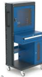
SERIE 103 2