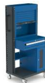
SERIE 103 2 P