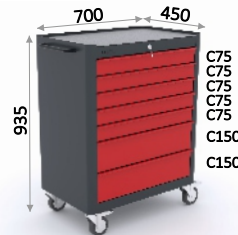
SERIE 151 6

0,131 m 3 - 131 l 50,36 Kg 1,4 m 2 7 u. 760 x 510 x 995 mm