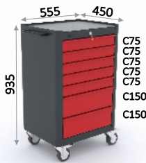
SERIE 151 5

0,099 m 3 - 99 l 43,97 Kg 1,07 m 2 7 u. 615 x 510 x 995 mm