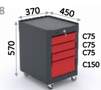
SERIE 151 8

0,0314 m 3 - 31,4 l 24,68 Kg 0,36 m 2 4 u. 430 x 510 x 630 mm